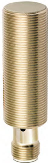
Bilder rein Indikativ